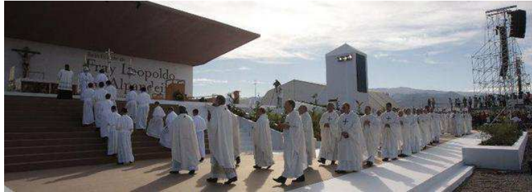
Procesión al altar

Fray Leopoldo de Alpandeire nunca dejó Granada. Pero hoy, con fervor y pasión, uno de los personajes más queridos, históricos y representativos de nuestra ciudad es, sin duda, protagonista de la jornada.