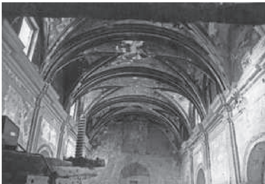
Interior de la iglesia. En primer plano, prensa de viga