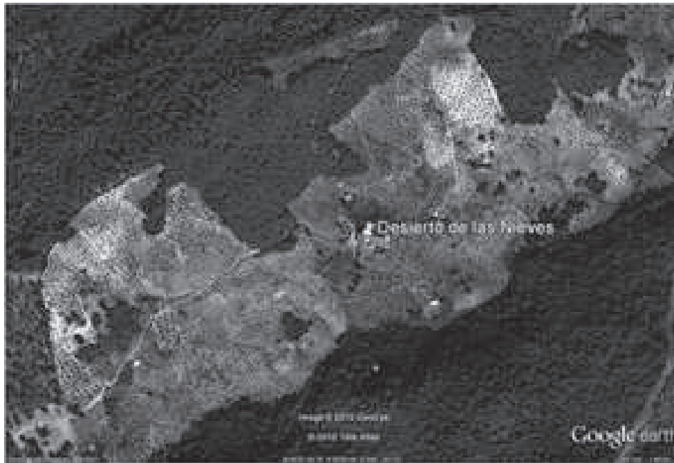
Vista aérea del Desierto de las Nieves