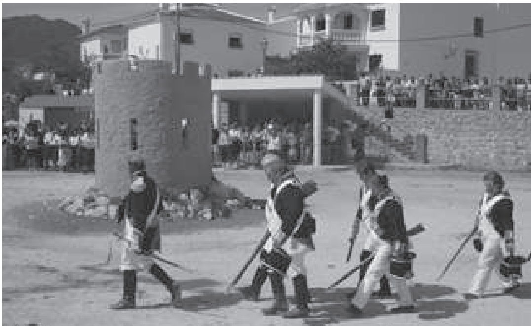
Escenificación histórica de la toma de la torre vigía en las jornadas Yunquera Guerrillera de 2012