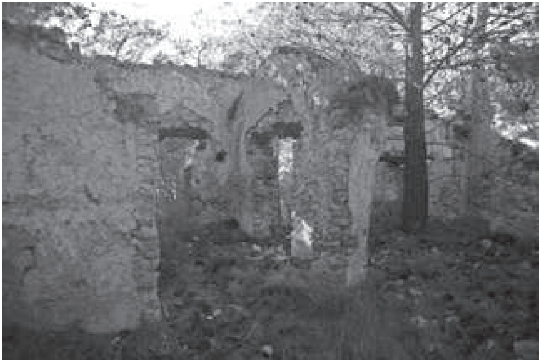
Ermita número 8