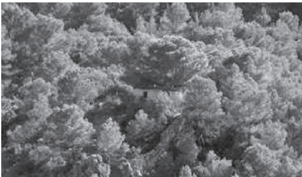
Ermita número 10 o del Castigo