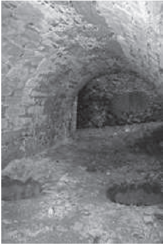
Antigua despensa o depósito para aceite en el subsuelo del edificio principal