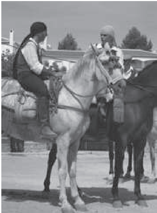
Guerrilleros serranos actuando en la escenificación histórica “Yunquera Guerrillera”