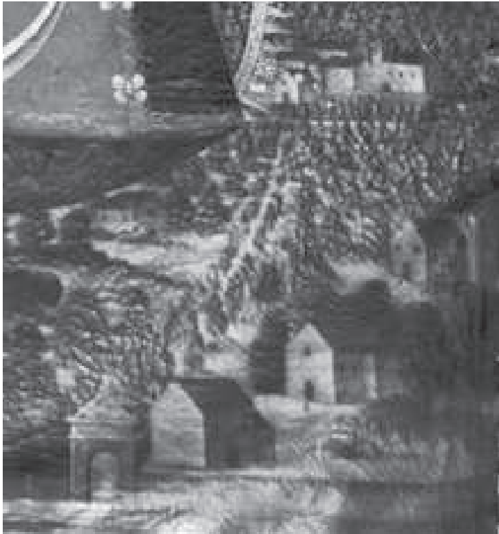
Portada y ermitas. Detalle del cuadro conservado en la iglesia del Espíritu Santo