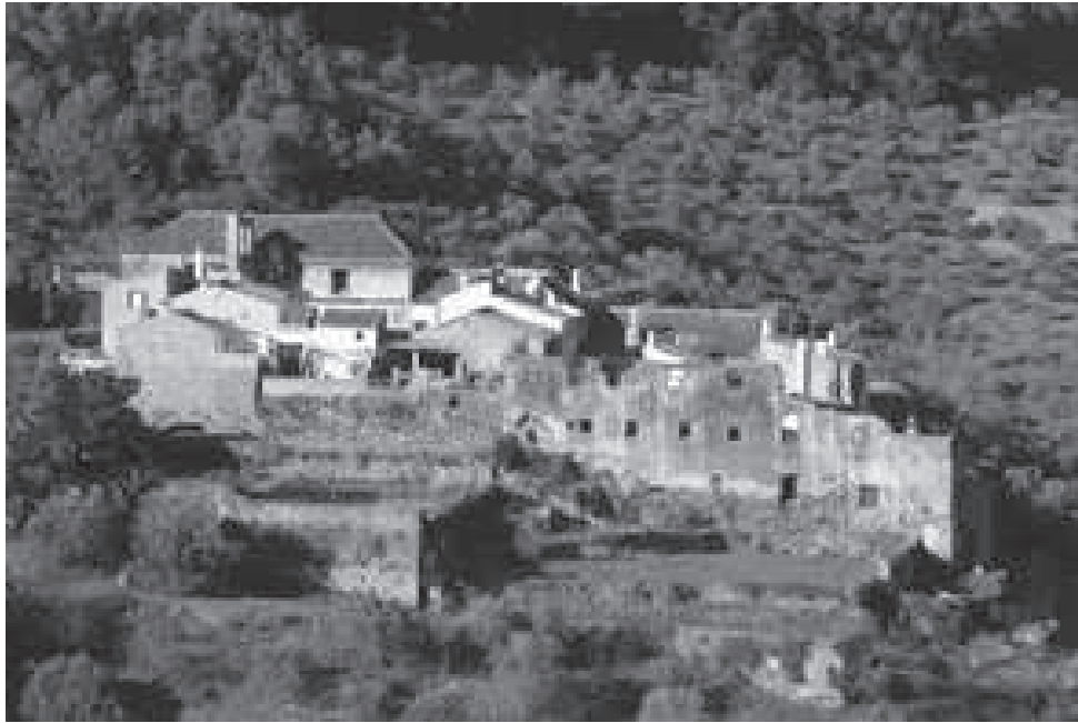
Vista del convento desde la huerta