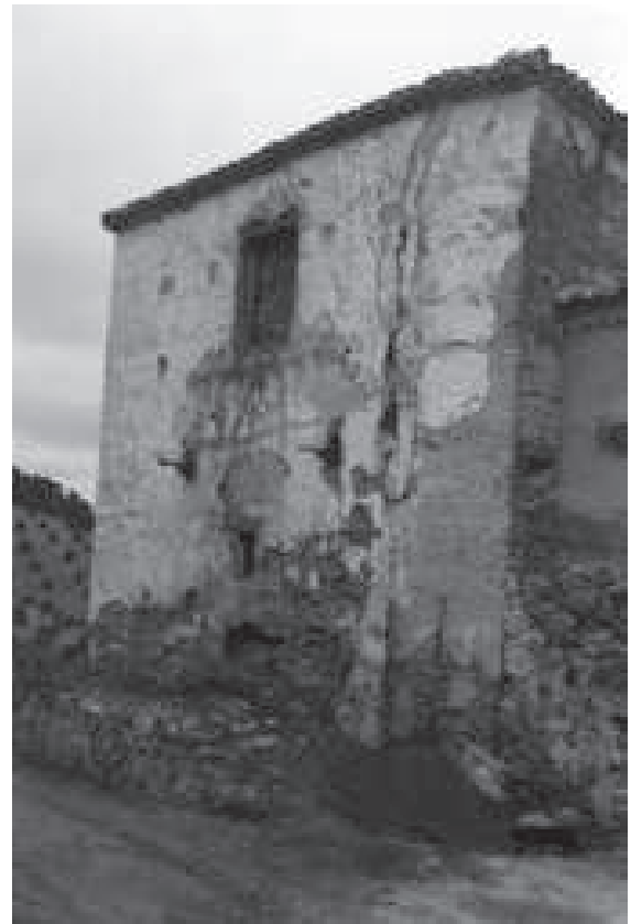
Exterior de la cabecera de la iglesia