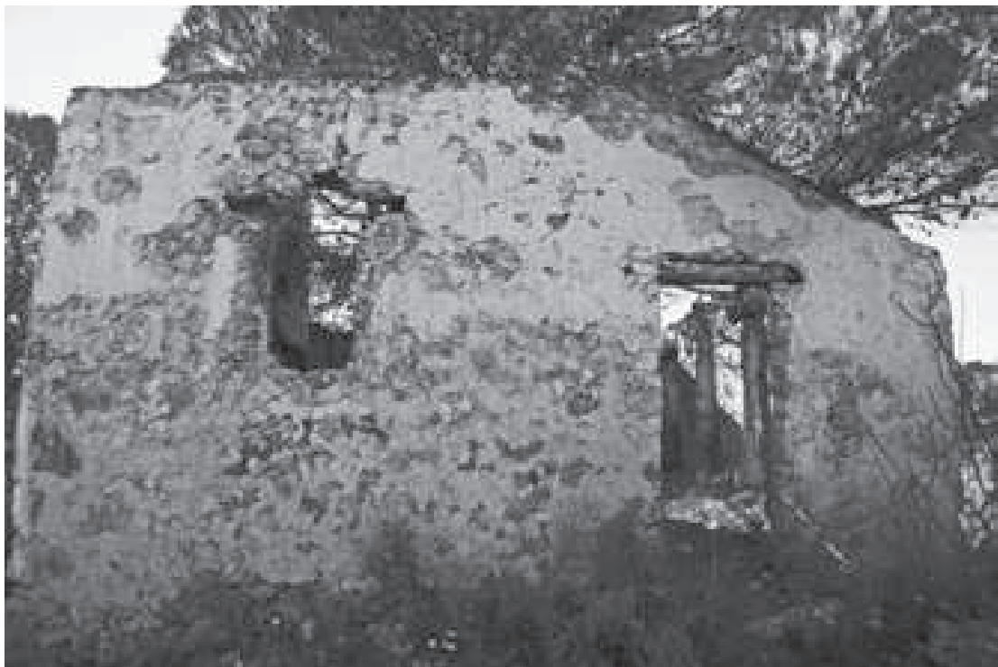
Ermita número 9