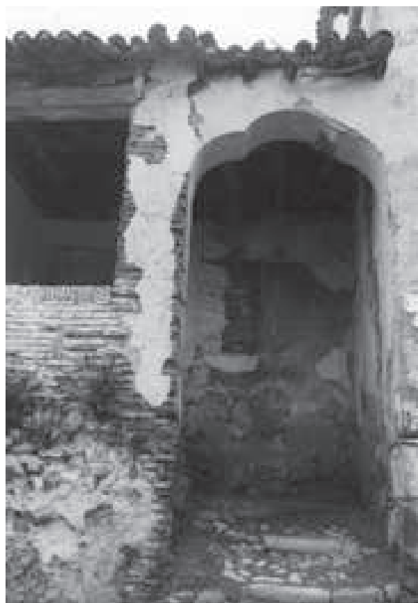
Portada de acceso al edificio principal