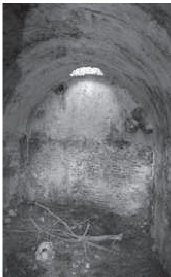
Aljibe de la ermita número 10