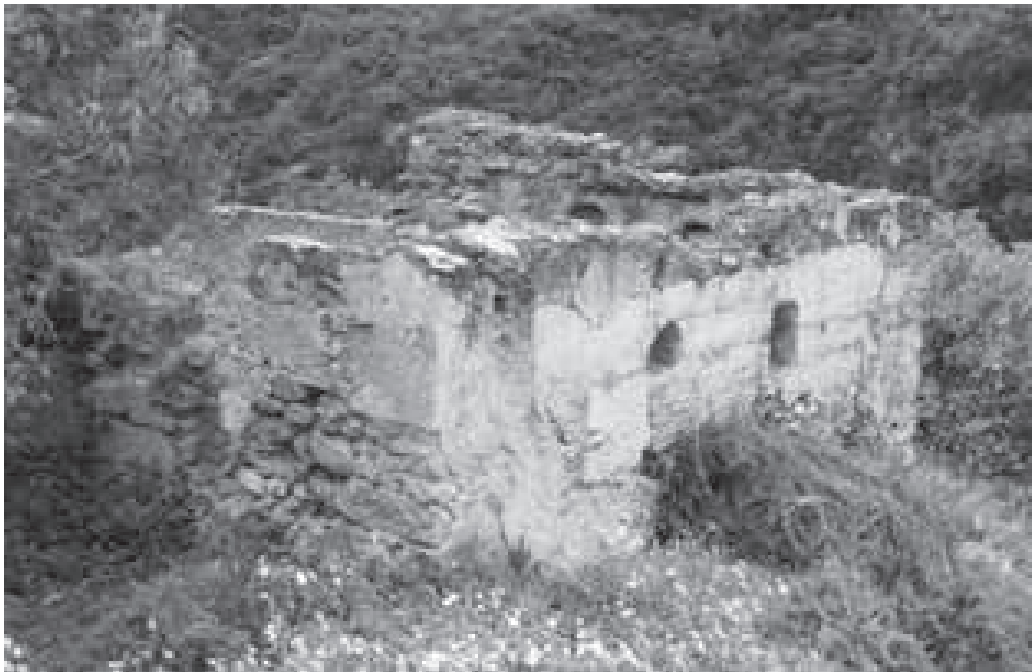
Ermita de San Andrés