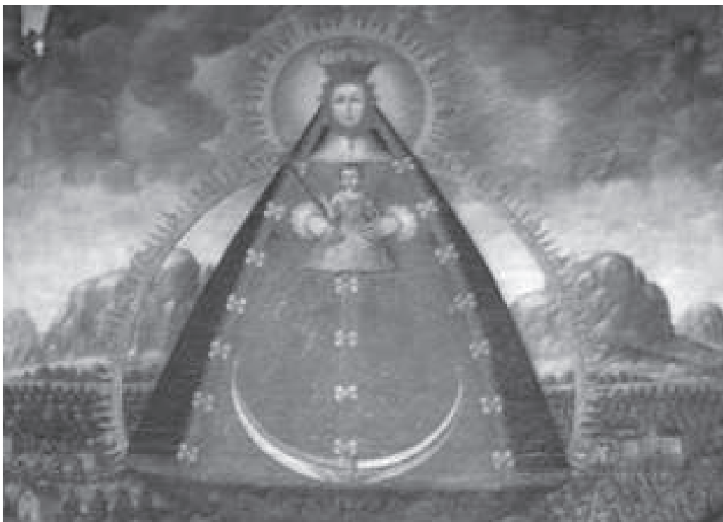
Cuadro de la Virgen de las Nieves, conservado en la iglesia del Espíritu Santo de Ronda