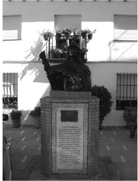
Figuras 6 y 7

En la misma cara, un azulejo de la ceramista María Guillén, según texto de Francisco Siles Guerrero, que dice (Fig. n° 7):