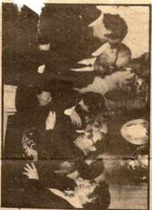
Presidió la procesión del Santo Entierro