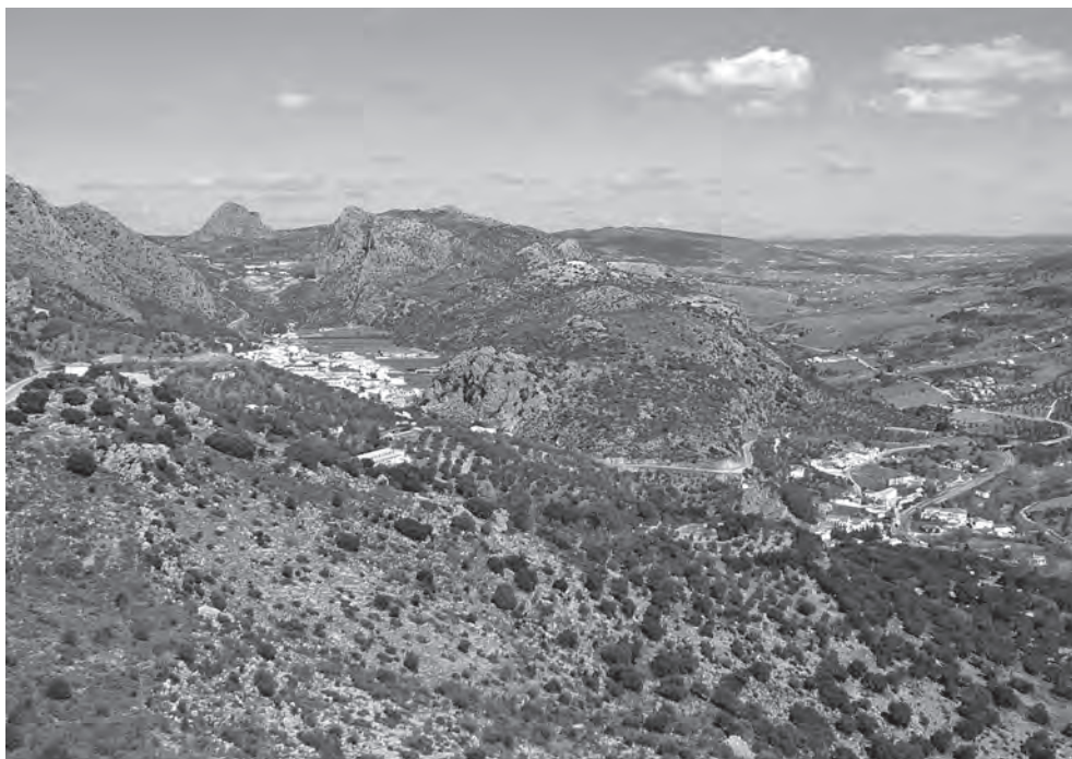
Vista de la villa de Benaolán y su término