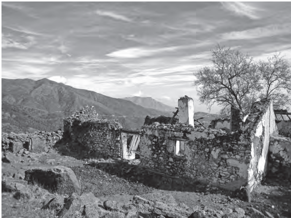
Ruinas de la venta Natías (Benahavís), en cuyo paraje estaba situada una rábita

peridotitas de una pendiente muy acusada), nos habla a las claras de la funcionalidad de esta “mezquitilla”. Seguramente, además de oratorio para un santón, servía para marcar un territorio concreto, gestado a la manera clásica, como de hecho la propia documentación castellana evidencia.