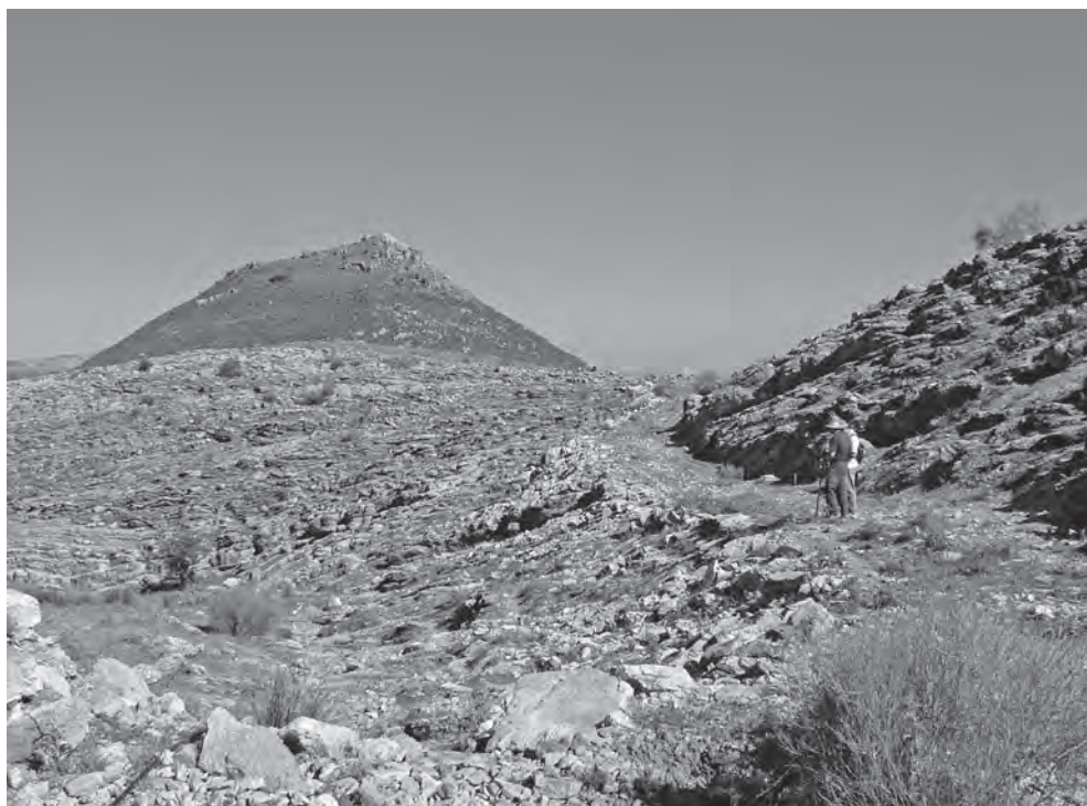
Cerro Malhacer, término de Cartajima, ubicación de la rábita de Abū l-Ḥasan