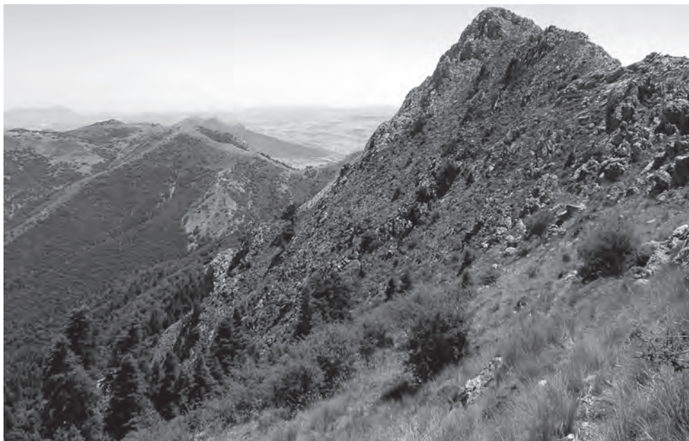
Cerro de San Cristóbal (Grazalema), donde estaba situada la rábita de Muley Hacén

Ermita es, indudablemente, traducción de rábita, como sabemos fehacientemente para otros lugares 43 y como Alcalá, entre otros, pone en evidencia, 44 y San Cristóbal es la nueva advocación a la que se consagra la construcción, anteriormente dedicada, seguramente, porque fue ese mismo santón de carácter tal vez local el que la construyó y por vivir en la misma, a un tal Hasan. Recordemos, en cualquier caso, el ejemplo del pico Mulhacén de Sierra Nevada, nombre en esta ocasión no dedicado a ningún personaje de probo comportamiento religioso sino al sultán nazarí Mawlay Hasan, padre de Boabdil.