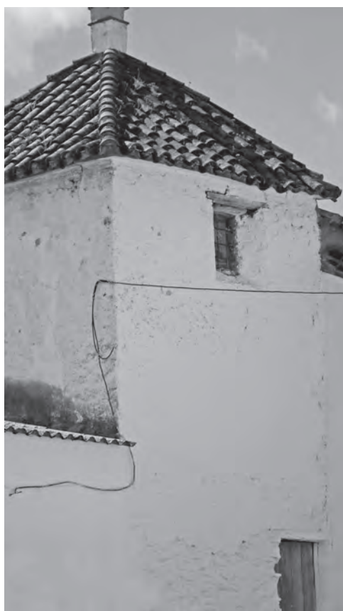
Arranque de un arco de herradura y torre (posible alminar) de la rábita de Benarrabá